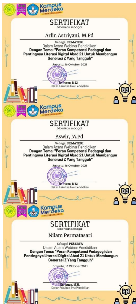
Gambar 2. E-Certificate untuk pemateri dan peserta

Sebagai ucapan terima kasih dan penghargaan kepada pemateri dan peserta maka pelaksana kegiatan ini memberikan e-certificate yang dikirimkan melalui email masing-masing.