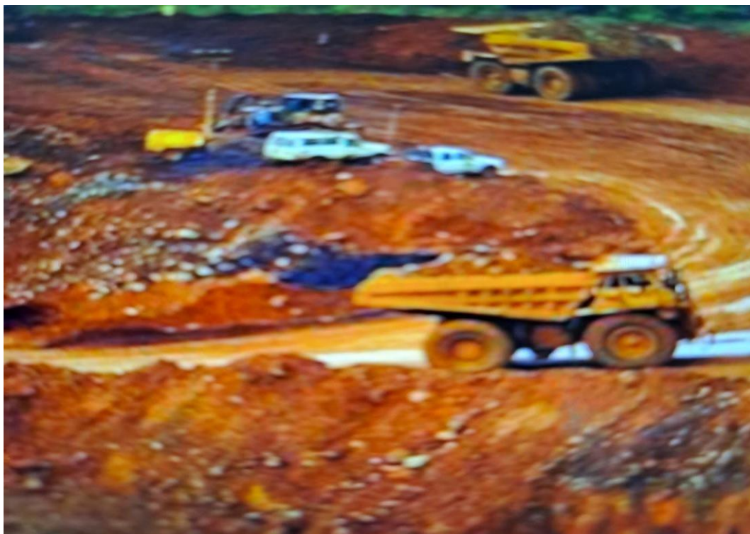
Gambar 4 Gunung yang sudah rata dengan dasar laut, Aktivitas Tahun 2021