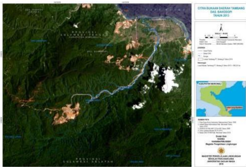
Gambar 5. Peta bukaan tambang tahun 2013.

Hasil pengamatan lapangan kegiatan penambangan bijih nikel didaerah penelitian menyebabkan hilangnya vegetasi dan berkurangnya fauna darat termasuk berkurangnya biota air (ikan). Pembukaan lahan yang dilakukan oleh perusahaan tambang dari tahun ketahun menyebabkan hutan menjadi gundul. Dari hasil interpretasi citra yang disajikan dalam dibawah terlihat peningkatan lahan terbuka dari tahun 2013 sebesar 960,24 Ha menjadi 1.186,30 Ha ditahun 2016. 8