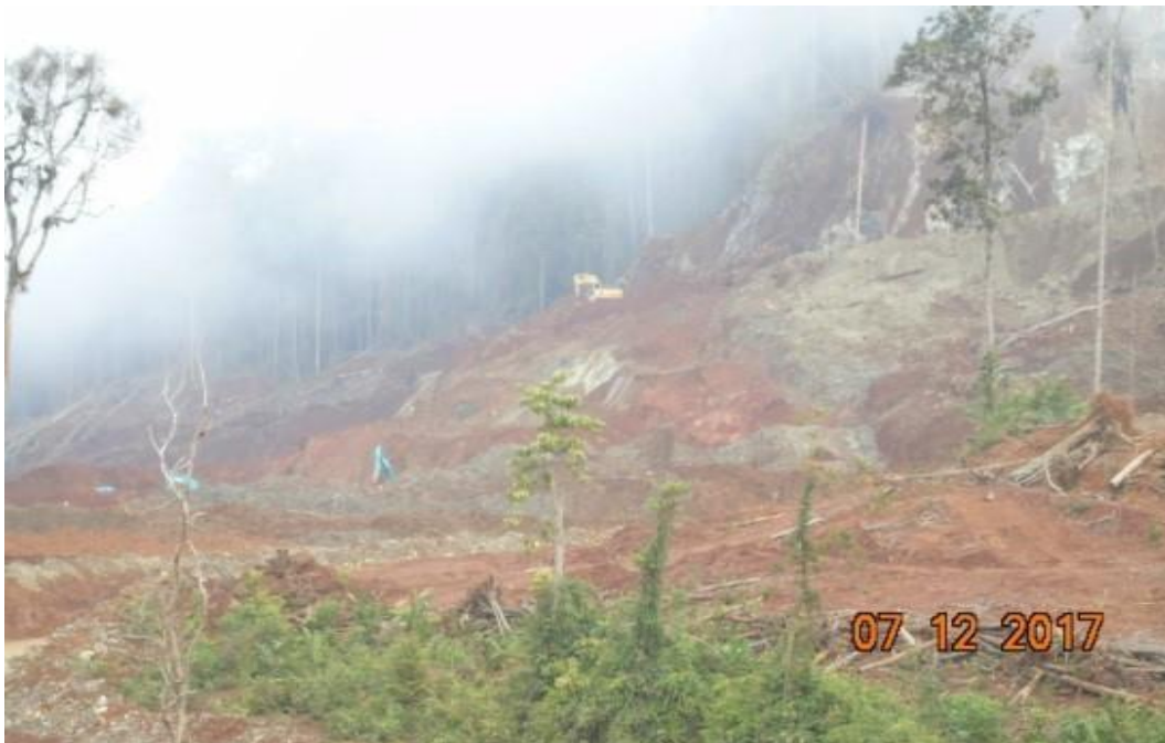
Gambar 1. Kegiatan pengupasan tanah pucuk (Dokumentasi lapangan)

Hasil pengamatan kerusakan komponen abiotik di daerah penelitian berupa perubahan topografi (dari yang berbukit menjadi datar dan berlubang). Hal ini terjadi dari proses penggalian dan pengupasan tanah bagian atas ( top soil ) atau dikenal sebagai tanah pucuk dan pengupasan tanah penutup ( overburden ), dengan kedalaman antara 8 meter sampai dengan 25 meter.