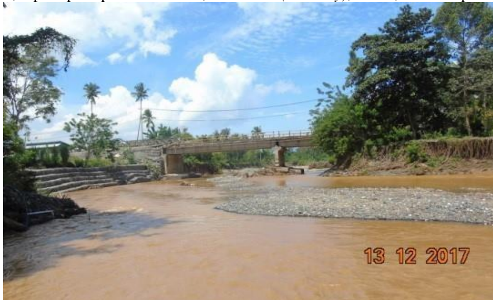
Gambar 3. Foto perubahan warna air sungai yang terjadi di daerah penelitian (Dokumentasi lapangan)

Selain perubahan topografi, penurunan kualitas air permukaan juga menjadi salah satu jenis kerusakan komponen abiotik yang dikaji di daerah penelitian. Air sungai yang mengalir di Daerah Aliran Sungai (DAS) Bahodopi dapat diketahui potensi kerusakan salah satunya dari analisis kualitas airnya. Kualitas air dari suatu perairan dapat dipresentasikan dari parameter fisika dan kimia. Parameter fisika yang digunakan antara lain suhu, kekeruhan, warna dan TSS. Parameter kimia yang digunakan adalah pH. Parameter kualitas air tersebut, beberapa dapat menunjukkan tanda-tanda terjadinya penurunan kualitas air, seperti pada perubahan suhu, kekeruhan ( turbidity ), warna, TSS dan pH. 6