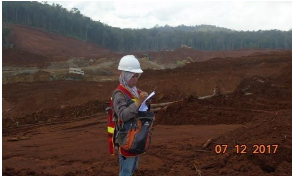
Gambar 2. Kegiatan pengupasan tanah penutup (Dokumentasi lapangan)

Selain perubahan topografi, penurunan kualitas air permukaan juga menjadi salah satu jenis kerusakan komponen abiotik yang dikaji di daerah penelitian. Air sungai yang mengalir di Daerah Aliran Sungai (DAS) Bahodopi dapat diketahui potensi kerusakan salah satunya dari analisis kualitas airnya. Kualitas air dari suatu perairan dapat dipresentasikan dari parameter fisika dan kimia. Parameter fisika yang digunakan antara lain suhu, kekeruhan, warna dan TSS. Parameter kimia yang digunakan adalah pH. Parameter kualitas air tersebut, beberapa dapat menunjukkan tanda-tanda terjadinya penurunan kualitas air, seperti pada perubahan suhu, kekeruhan ( turbidity ), warna, TSS dan pH. 6