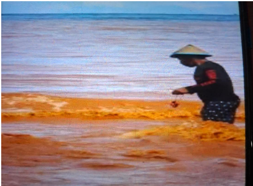
Gambar 5 Air Laut tercemar limbah tambang PT. IMIP (Dokumentasi Tahun 2020)

Berdasarkan jenis kerusakan yang telah dikaji maka peneliti menentukan tingkat kerusakan berdasarkan nilai skoring/harkat terhadap variable dan tolok ukur yang telah ditentukan pada pengamatan lapangan pada lokasi penambnagan dan menentukan indeks pencemaran untuk tingkat kerusakan perairan sungai.