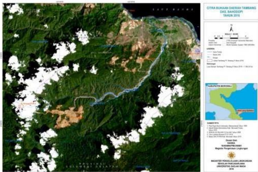
Gambar 6. Peta bukaan tambang tahun 2016.

Dari harkat/skor yang diperoleh pada kriteria jenis kerusakan dapat dilihat tabel tingkat kerusakan lingkungan di lokasi penelitian