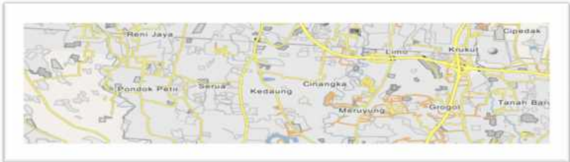
Gambar 1 Peta Kelurahan Cinangka

Lokasi mitra KKN Online ini tepatnya berada di Kelurahan Cinangka Rt 02 Rw 11, Kecamatan Sawangan Kota Depok, Provinsi Jawa Barat, Indonesia.