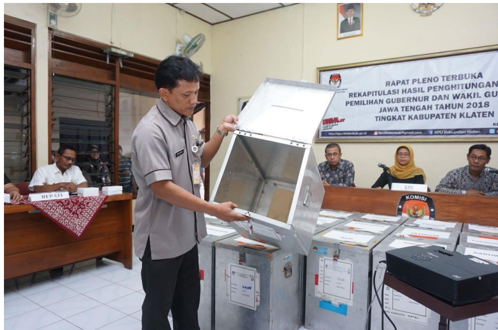
Gambar 4.2 Rapat Pleno KPU Klaten