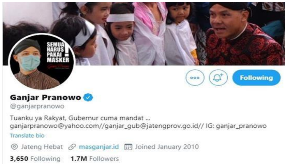
Gambar 4.5 :Twitter Ganjar Pranowo