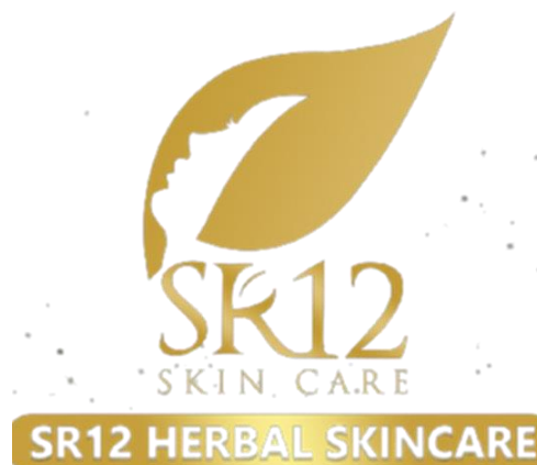
Gambar 1.3

SR12 adalah salah satu produk kecantikan dan herbal yang diproduksi oleh PT. SR12 Herbal Perkasa, hingga saat ini sudah banyak produk SR12 mulai dari skincare , bodycare , kosmetik, hingga suplemen dengan berbagai manfaat untuk melengkapi rangkaian perawatan tubuh, kulit, hingga wajah. Produk SR12 juga sudah terdaftar di BPOM sehingga baik dan aman untuk digunakan. Perusahaan ini menggunakan tagline “ Beauty is not dream. Bring back your beauty ” tagline ini menggerakkan motivasi kepada masyarakat khususnya perempuan bahwasannya kecantikan itu bukanlah sekedar mimpi. Jika perempuan merasa mimpinya menjadi cantik telah menghilang. Maka SR12 siap mengembalikan mimpi tersebut dengan berbagai macam produk inovasi yang telah ada.