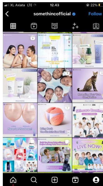
Gambar 4.1 unggahan kampanye #RespectMyBody

Konten pada Instagram Somethinc ditemakan dengan warna soft untuk menunjukkan sisi feminisme seorang perempuan. Postingan juga tidak hanya berupa gambar namun dilengkapi dengan caption dan video yang menarik. Konten pada Instagram @somethincofficial memiliki keunikan, dimana konten sangat bervariasi tidak hanya memasukkan unsur marketing produk, tetapi juga berisi video-video yang menarik mata audiens untuk ditonton.