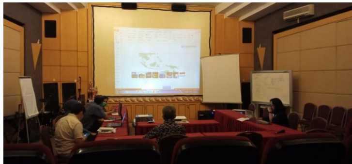
Gambar 4.7 Evaluasi Kegiatan

Dalam mengukur keberhasilan rancangan taktik dan Strategi Public Relations PT SINGGARMULIA mempunyai cara tersendiri yaitu dilakukannya diskusi dengan semua department dan menerima advise lalu melakukan komunikasi dua arah antara perusahaan dengan karyawan supaya kebijakan yang ada di perusahaan bisa tersampaikan dan dijalankan oleh masing-masing karyawan. Untuk klien yaitu adanya tingkat kepercayaan yang tinggi dari klient terhadap perusahaan.