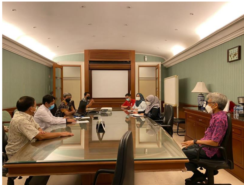
Gambar 4.5 Diskusi terbuka bulanan