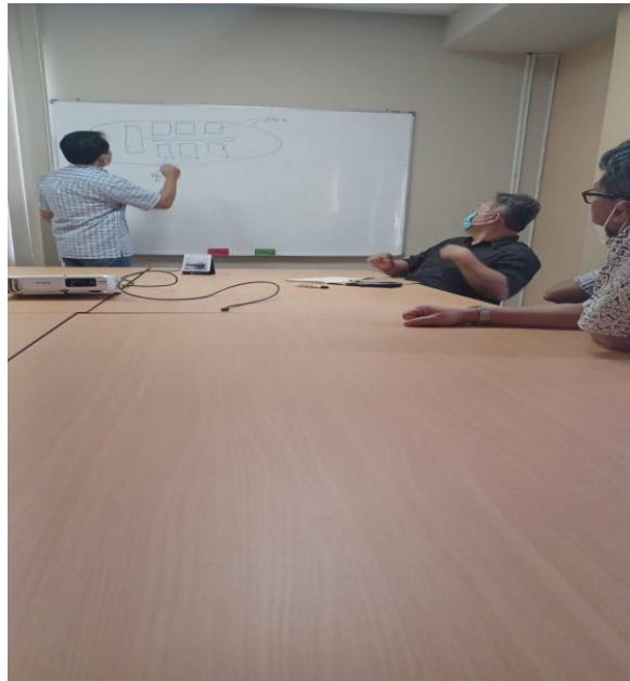
Gambar 4.6 Diskusi dengan klien

memanfaatkan email dalam memberikan informasi, sosialisasi dan kebijakan dari management perusahaan kepada eksternalnya. Untuk faktor penghambatnya adalah kurangnya kesadaran karyawan dalam membantu menginformasikan kebijakan yang ada di perusahaan dan kurangnya tanggung jawab terhadap pekerjaan.