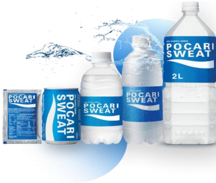
Gambar 4. 2 Pocari Sweat