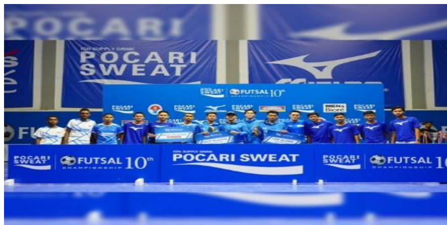
Gambar 4. 5 Event Pocari Sweat Futsal Championship