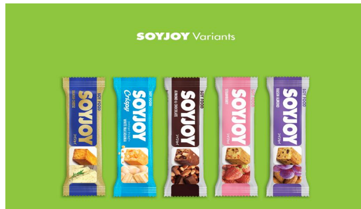
Gambar 4. 3 Soyjoy