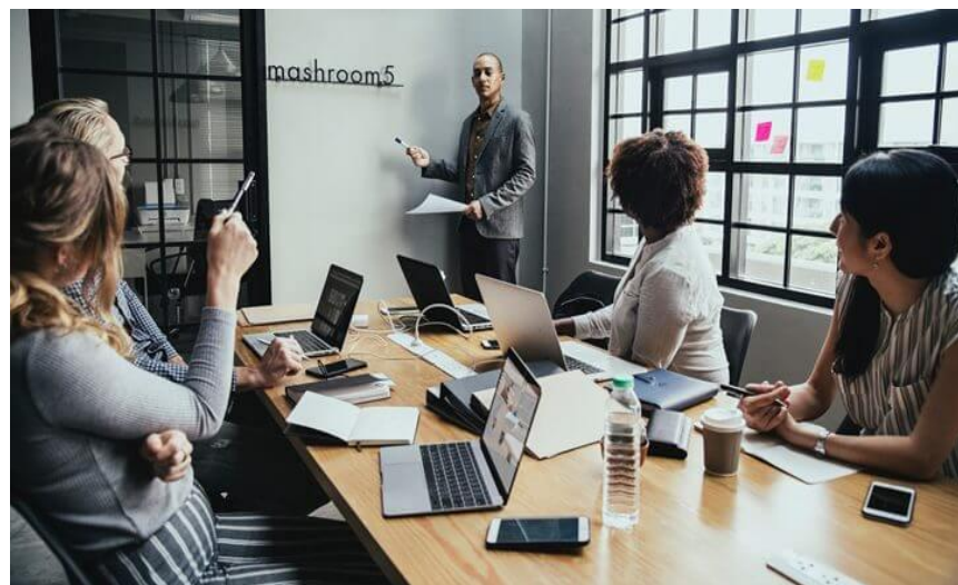
Gambar 4. 6 Citra Perusahaan