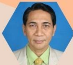
Prof. Pribadiono Quantum HRM Int.