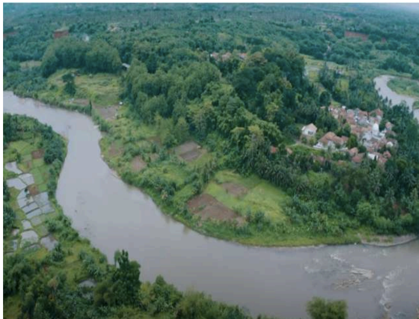
Gambar 1. Gambar Letak Desa Kuripan.

muda mencari pekerjaan di luar desa untuk membantu ekonomi keluarga. Pada tahun 2000, propinsi Banten terbentuk dan pembangunan berlangsung sangat cepat. Dibukanya pabrik-pabrik di sekitar BSD Tangerang Selatan dan di Bogor (Parung dan Gunung Sindur) serta perkembangan toko-toko di pasar Parung menyerap tenaga kerja dari daerah sekitarnya termasuk desa Kuripan.