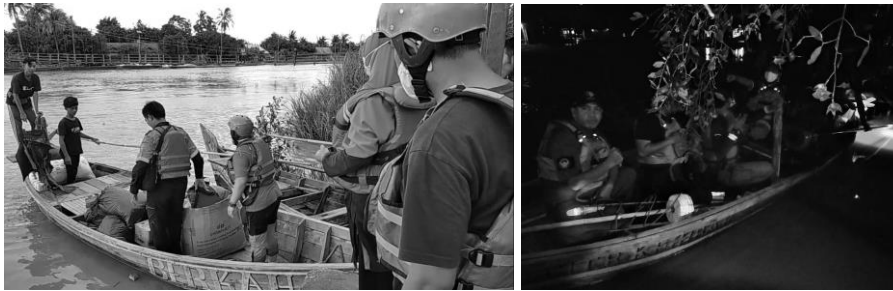
Gambar 1. Upaya penjangkauan dan distribusi bantuan dilakukan menggunakan perahu karena lokasi masih terisolir akibat banjir

Indonesia dengan mengirimkan tim untuk melakukan asesmen situasi dan kebutuhan. Selanjutnya tim melakukan koordinasi dengan otoritas setempat dan mengoordinasi posko serta alur donasi hingga penyaluran bantuan. Bantuan disampaikan secara langsung kepada warga dengan menggunakan perahu karena akses jalan tertutup banjir (Gambar 1).