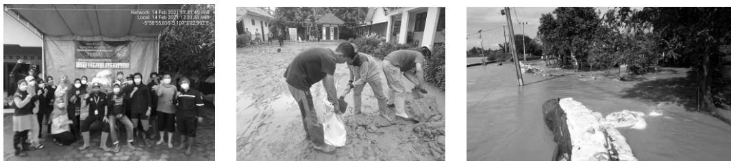
Gambar 2. Sebagian perwakilan institusi yang tergabung dalam GEREBEK Indonesia dan aktivitas pembersihan lingkungan sekolah serta tanggul sementara

Hasil wawancara kepada warga ditemukan bahwa dulu sekali, banjir terjadi dalam siklus 5 tahunan, kemudian berubah menjadi 3 tahunan. Namun pada akhirnya banjir datang tiap tahun dan lokasi tanggul yang jebol berpindah-pindah. Dengan demikian, sebagian warga melakukan beberapa tindakan antisipasi, namun sebagian lainnya tidak siap menghadapi banjir yang datang tiba-tiba, khususnya jika ada anggota keluarga yang sedang sakit.