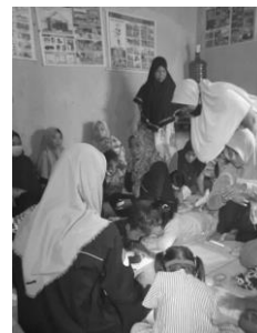
Gambar 4. Intervensi (dukungan psikososial)