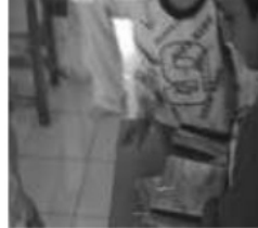
Melaksanakan Tugas Piket