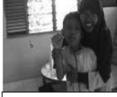
Mencontohkan anak menyapa