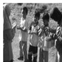
Mencontohkan cara berdo'a