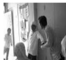
Guru mengajak berbicara