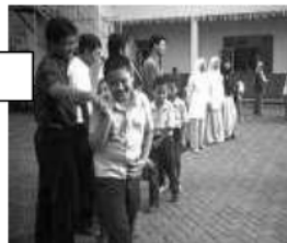
Tersipu malu ketika bersalaman

Perilaku malu yang merupakan bagian dari emosi yang ditunjukkan anak autisme ketika berinteraksi dilakukan cara berjalan lambat dan menundukkan kepala, bersalaman tidak menatap, bersalaman dengan menundukkan kepala, berbicara dengan menundukkan kepala, malu ketika datang ke sekolah, dan tampil dengan kaku karena malu dalam peragaan busana.