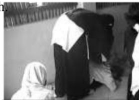
Guru membimbing gerakan sholat

Perilaku lain yang ditunjukkan adalah perilaku guru dalam memberi bimbingan secara individual dalam belajar, karena anak autisme belum dapat belajar secara klasikal yang boasanya dilakukan oleh guru pendampingnya, namun untuk kegiatan lain yang tidak berkenaan dengan pembelajaran guru yang lain terlibat dalam pengembangannya seperti sosialisasi dan pembiasaan lain yang dilakukan di sekolah