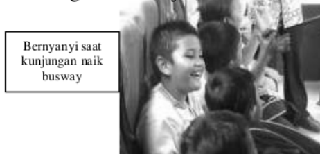
Bernyanyi saat kunjungan naik busway

Perilaku guru dalam mengembangkan interaksi sosial anak autisme memperlihatkan perilaku guru dalam memberi penguatan dilakukan dengan diberi hadiah agar mau belajar, dan tidak memberikan mainan jika tidak mau belajar.