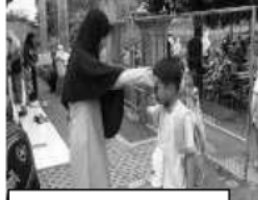
Guru mencontohkan bersalaman

Perilaku guru dalam mencontohkan perilaku agama ditunjukkan dengan berikrar , berdo'a sebelum dan sesudah kegiatan, mengangkat tangan, mencontohkan bacaan hafalan surat, mencontohkan gerakan sholat berjamaah, mencontohkan bacaan sholat berjamaah dan mencontohkan bacaan Iqro.