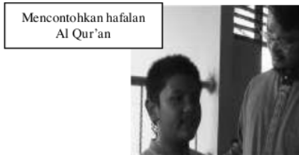
Mencontohkan hafalan Al Qur'an