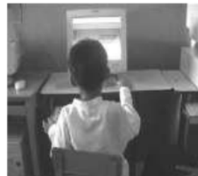
Diperbolehkan main komputer karena sudah selesai mengerjakan tugas