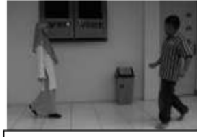
Membimbing anak menghafal dengan berlari-lari kecil