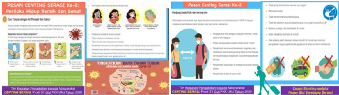
Gambar 2. Pesan Gizi Seimbang mengenai Perilaku Hidup Bersih dan Sehat (Kementerian Kesehatan Republik Indonesia, 2020)