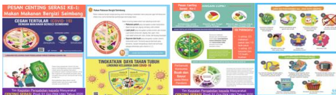
Gambar 1. Pesan Gizi Seimbang mengenai Konsumsi Aneka Ragam Makanan

Data dianalisis secara univariat untuk mengetahui gambaran karakteristik sosiodemografi, serta pengetahuan dan sikap kader posyandu mengenai gizi seimbang. Peningkatan skor pengetahuan dan sikap kader posyandu antara sebelum dan setelah diberikan edukasi gizi seimbang melalui pesan berseri di media sosial, dianalisis menggunakan uji t-dependen dengan tingkat kemaknaan 5%.