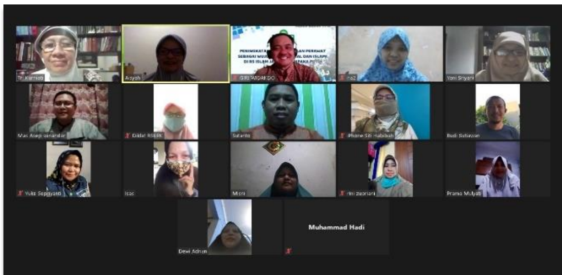
Gambar 2. Koordinasi dan Pembentukan Forum Komunikasi Preceptor Klinik RS Islam Jakarta Cempaka Putih, Agustus 2020