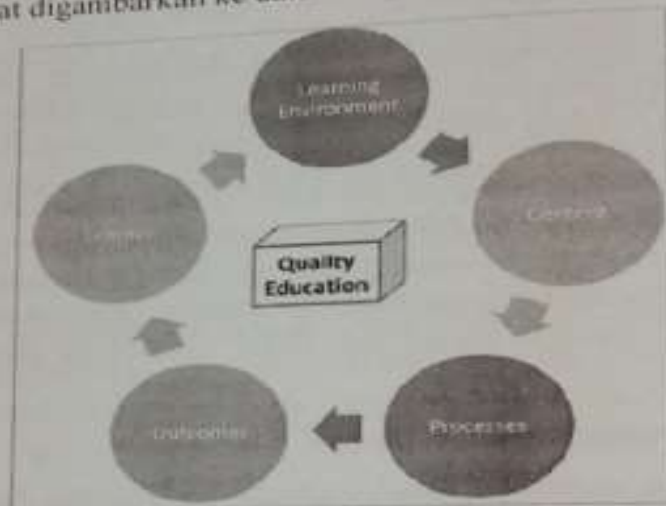
Gambar 1. Dimensi mutu pendidikan

dan bahan ajar lainnya, media dan alat peraga, perpustakaan dan laboratorium, kantin sekolah, buku pelajaran dan kurikulum yang digunakan, semua yang dapat diupayakan sekolah dalam mendukung proses pembelajaran yang aman dan nyaman. Teaching and learning , dimensi ini meliputi peserta didik, pendidik, dan kurikulum. Efektifitas proses pembelajaran dipengaruhi oleh lama waktu belajar, metode belajar yang digunakan, penilaian, umpan balik, bentuk penghargaan bagi peserta didik, dan jumlah peserta didik dalam satu kelas. Outcomes yaitu lulusan yang mampu membaca dan menulis ( literacy ), berhitung ( numeracy ), dan kecakapan hidup ( life skills ), memiliki kecerdasan emosional dan sosial ( emotional quotient dan social intelligences ), dan nilai-nilai yang diperlukan masyarakat, dan yang terakhir adalah context dan environments yaitu alam, sosial, ekonomi, dan budaya. Dimensi mutu pendidikan dengan interaksi antar dimensi dapat digambarkan ke dalam bagan sebagai berikut.