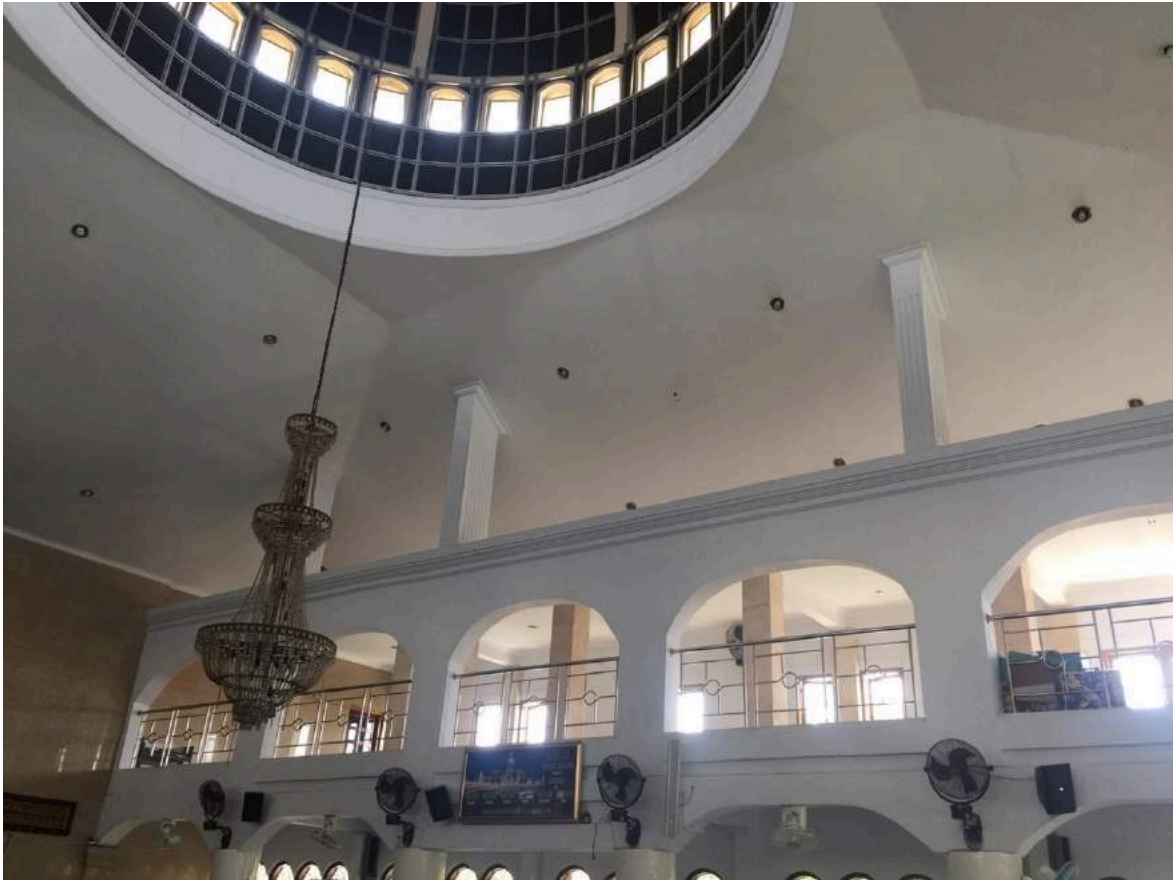
Kondisi ruang dalam Masjid EL-Syifa