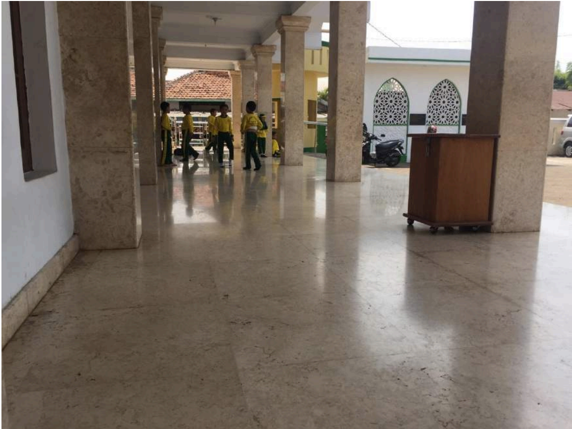
Kondisi lantai dasar dari Masjid El-Syifa tepatnya yaitu di selasar atau teras depan Masjid El-Syifa