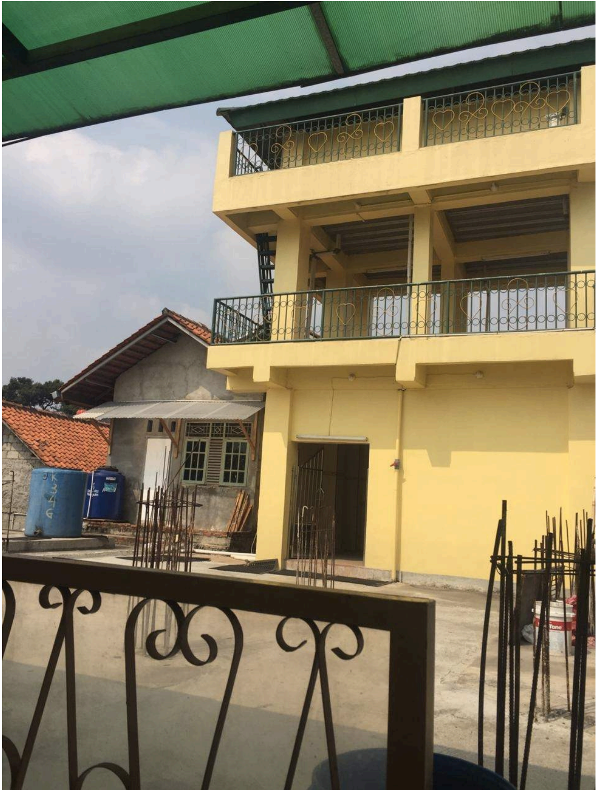
Kondisi lantai 2 masjid El-Syifa yang masih berupa dag beton, dan belum kembangkan menjadi ruang-ruang fungsional sebagaimana mestinya