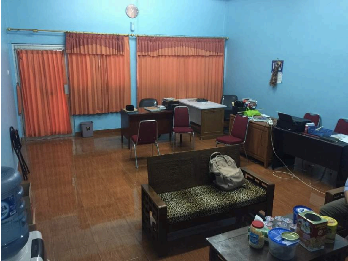
Kondisi ruang pengurus Masjid El-Syifa