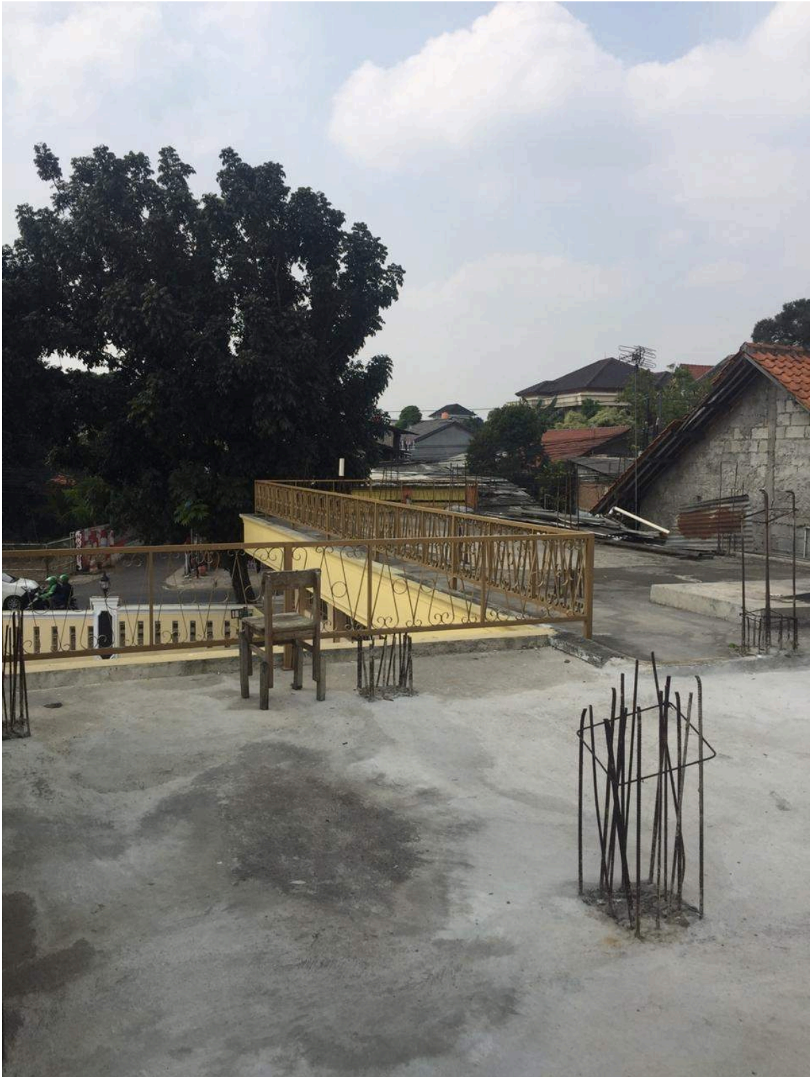
Kondisi lantai 2 masjid El-Syifa yang masih berupa dag beton, dan belum kembangkan menjadi ruang-ruang fungsional sebagaimana mestinya