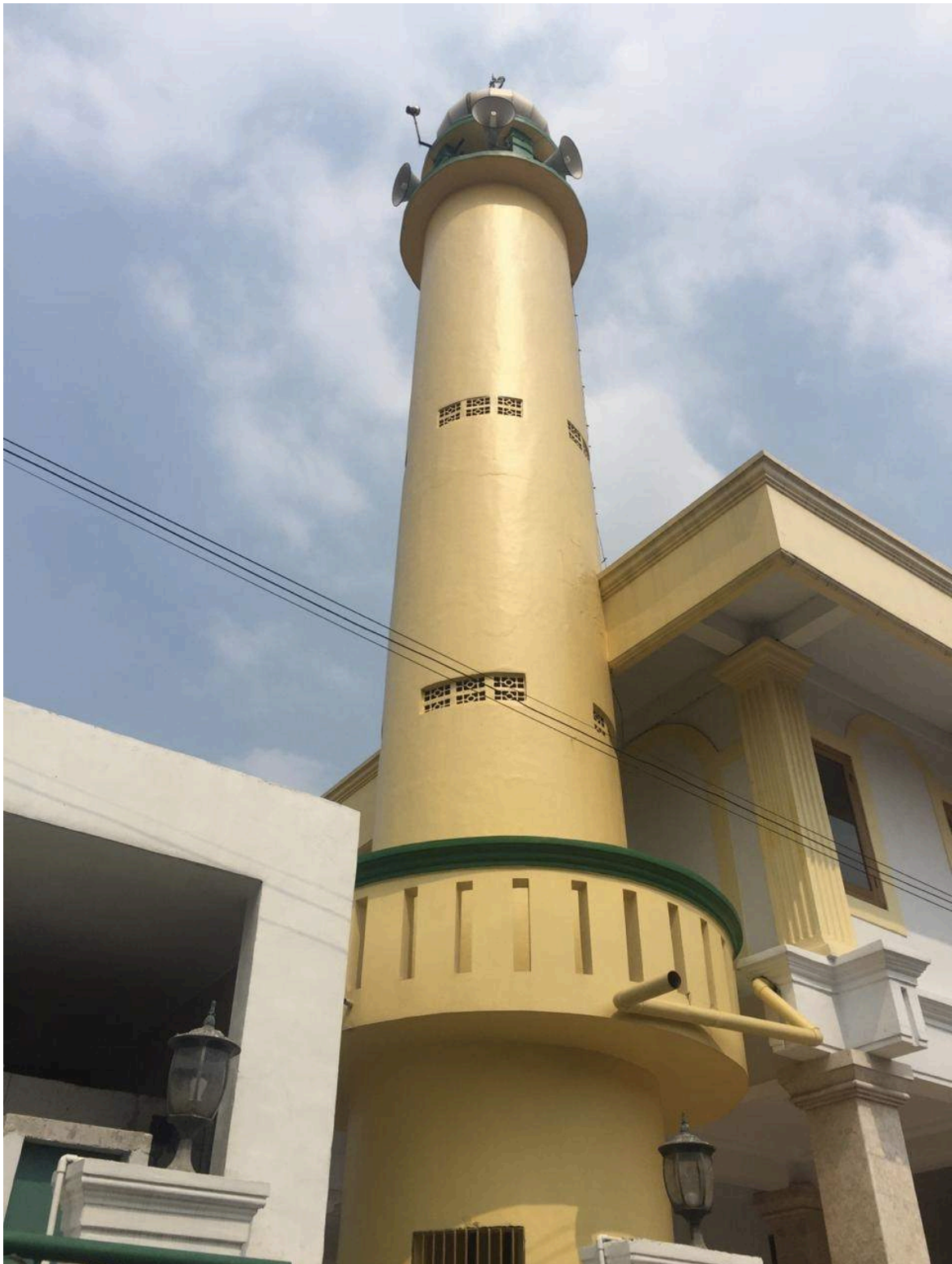
Tampak Masjid El-Syifa eksisting dari Jalan samping yang menuju ke Sekolah MI El-Syifa dan Taman Kanak-Kanak El-Syifa