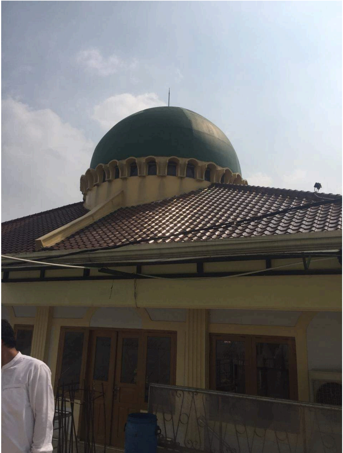
Kondisi lantai atas dari Masjid El-Syifa yang rencananya akan dibangun untuk pengembangan, namun sampai saat ini belum dapat direalisasikan