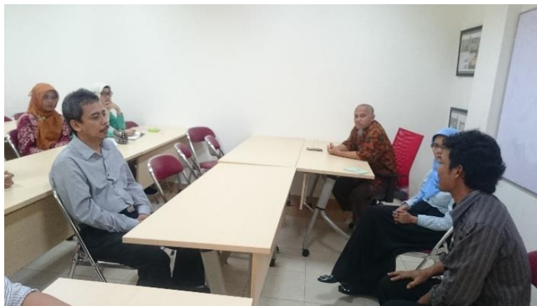
Gambar 1. Mengundang salah satu tokoh masyarakat di PSA-UMJ

Lokasi taman bermain yang dipilih adalah lahan kosong yang berada di depan sekolah dan berada satu lokasi dengan pondok baca sehingga diharapkan dengan adanya lokasi yang terintegrasi seperti ini memberi peningkatan nilai pada masing-masing fungsi ruang tersebut (Hakim, 2016). Tujuan lain menggabungkan taman bermain dan pondok baca ini adalah menjadikan kegiatan membaca sebagai wisata ilmu pengetahuan yang ditanamkan sejak dini tanpa adanya rasa paksaan (Basalamah, Rizal, & Efendi, 2020). Pada jangka waktu panjang, ruang terbuka yang dimanfaatkan sebagai pusat aktivitas anak-anak dapat dijadikan pusat mitigasi bagi penduduk setempat sehingga diharapkan lebih memudahkan para orang tua mencari dan mengumpulkan anak-anak pada saat terjadi gempa atau bencana alam lainnya (Prihatiningrum, Ramawangsa, Bahri, & Yundrismein, 2018).