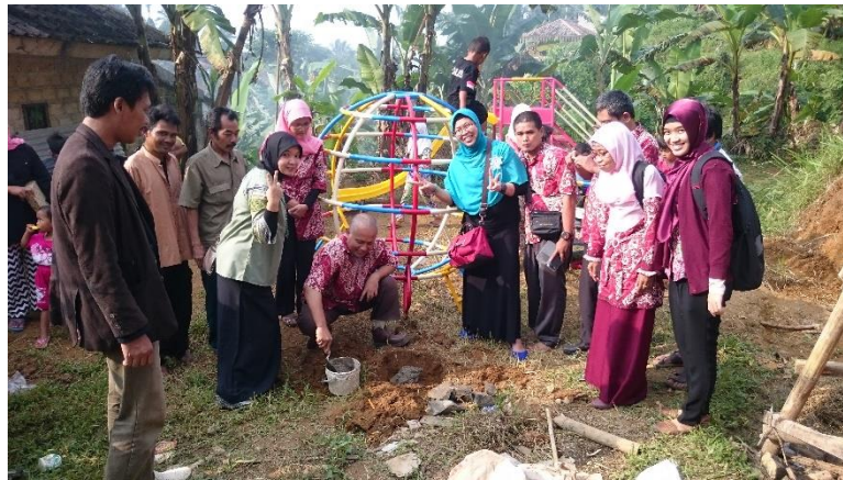
Gambar 2. Pemasangan alat bermain secara simbolik

Untuk melihat keberhasilan dari kegiatan ini dilakukan evaluasi. Adapun waktu yang ditetapkan oleh BKKBN hanya dalam waktu 1 bulan karena keperluan mereka untuk melaporkan kembali ke bagian anggaran kantor. Oleh karena keterbatasan waktu dan lokasi kegiatan yang sangat jauh dan sulit dijangkau maka data yang didapat oleh PSA-UMJ berasal dari laporan Pak Adi melalui hubungan telepon dan pesan singkat per minggu.