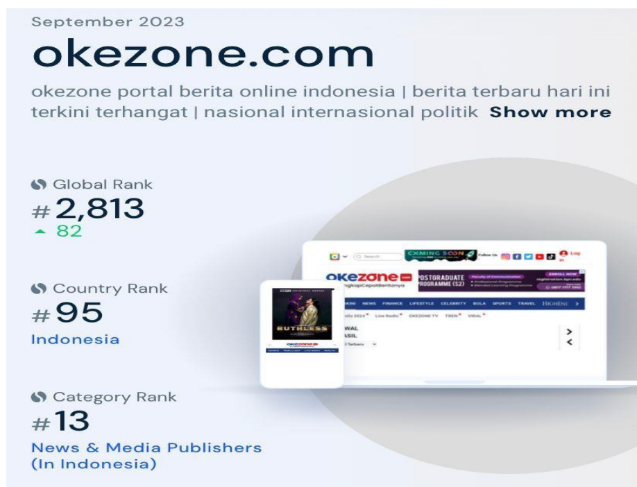
Gambar 1.2 Data Global Rank News and Media Publishers

edukasi. Okezone.com di dirikan pada 1 Maret 2007, okezone.com merupakan peloporberita online , yang selalu menyajikan berita yang aktual dan beritanya disajikan berita dalam bentuk ringkas (to the point) agar pembacanya dapat memahami secara langsung makna berita yang disajikan oleh kanal www.okezone.com .