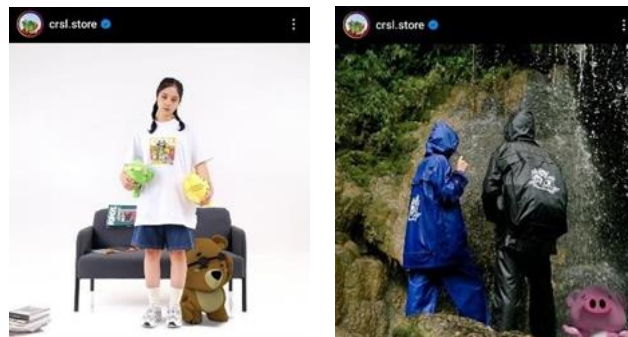
Gambar 4.2 Konten Instagram Crsl.Store

Konsep crsl store yang dijual adalah sesuai dengan tagline yang mereka buat yaitu “Animals as Your Best Friend” yang diharapkan calon pembeli dapat menjadi teman baik dan membawa keceriaan bagi setiap orang dengan mengadopsi salah satu karakter crsl store dalam bentuk produk yang ditawarkan. Crsl.Store sendiri peneliti melihat bahwa produk yang ditawarkan terlihat ceria dan bahagia dengan berbagai macam warna yang ada. Dengan produk tersebut crsl store bertujuan untuk membawa kebahagiaan dan keceriaan bagi setiap orang, terlihat dari dengan konten – konten instagramnya yang memiliki visualisasi dan ide konsep yang berwarna dan menarik perhatian (CRSL Gengs, 2021).