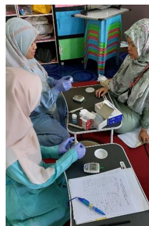
Gambar 2. Skrining Gula Darah dan Kolesterol