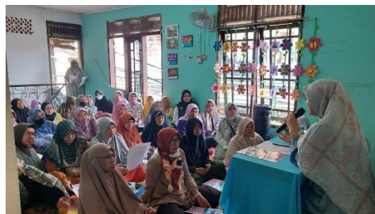
Gambar 1. Penyuluhan Diabetes Mellitus dan Penyakit Kardiovaskular

Kegiatan diawali dengan pengisian pre test oleh peserta. Kemudian dilanjutkan dengan penyuluhan dan pemaparan materi mengenai diabetes mellitus dan penyakit kardiovaskular serta tanya jawab. Setelah edukasi, dilakukan kembali pengisian lembar post test oleh peserta.