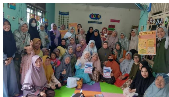
Gambar 3. Foto Peserta Penyuluhan dan Skrining

Hasil skrining ditemukan sebesar 64% memiliki kadar gula darah yang normal, dan 36% memiliki kadar gula darah tinggi atau melewati ambang batas normal. Hasil cek kadar kolesterol, sebesar 56% masuk dalam kategori normal dan 43% dalam kategori tinggi. Hasil pre test dan post test menunjukkan peningkatan rata-rata skor pengetahuan sebelum dan setelah diberikan edukasi yaitu dari 79,62 menjadi 88.