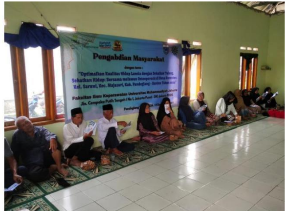
Penyampaian Materi Osteoporosis