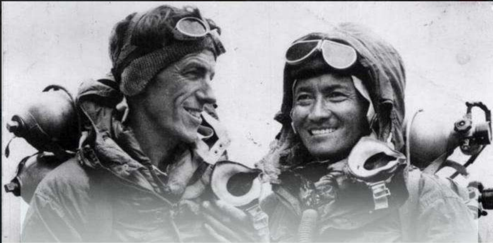
TENZING NORGAY (Pemandu Sir Edmund Hilary)