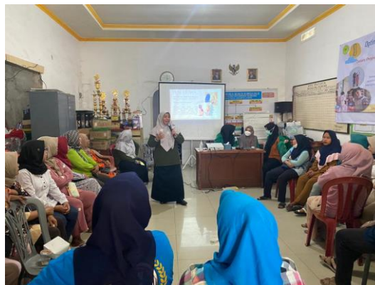
Gambar 2. Pemberian materi

Setelah kegiatan refleksi, dilakukan edukasi berupa penyuluhan materi tentang komunikasi efektif, peran kader posyandu dimasyarakat, dan mereview kembali cara pengecekan dan pengisian buku KIA kepada para kader. Pada kegiatan penyuluhan ini beberapa peserta juga melakukan diskusi atau tanya jawab kepada para narasumber seperti yang terlihat pada Gambar 2.