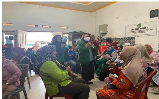
Gambar 4. Roleplay

Hasil evaluasi dari kegiatan pengabdian kepada masyarakat ini didapatkan hasil karakteristik para kader posyandu mawar RW.04 Kelurahan Cilincing Kecamatan Cilincing, seperti terlihat pada Tabel 1.