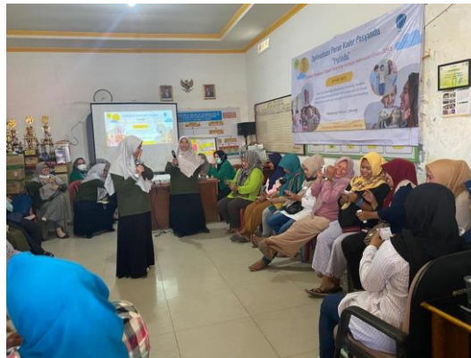
Gambar 3. Pembagian peran dan sekenario

masyarakat dapat terbangun dengan baik sehingga kegiatan posyandu di RW.04 Kelurahan Cilincing dapat merata dan diikuti oleh seluruh masyarakat, seperti terlihat pada Gambar 3 dan Gambar 4.