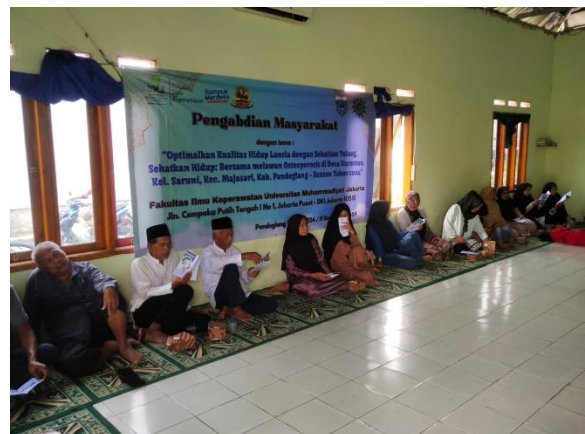
Penyampaian Materi Osteoporosis