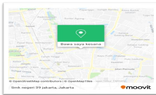
Gambar 1 Lokasi Pengabdian Kesehatan Masyarakat