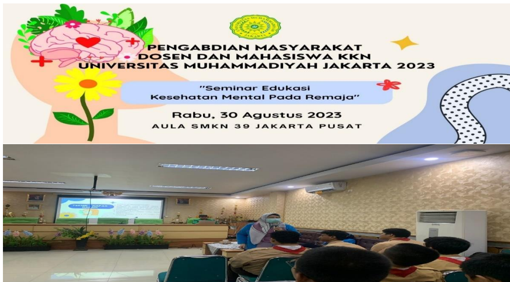
Gambar 2 Edukasi Kesehatan Mental Pada Remaja