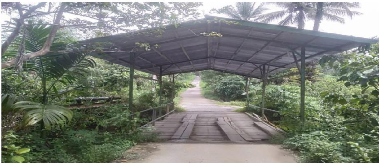
Gambar 1 Pintu masuk ke lokasi

Air terjun yang juga dikenal dengan nama lainnya sarasah yang biasa disebut oleh warga setempat. Air terjun lima tingkat (sarasah) Sikayan Balumuik terletak di desa Koto Baru Kelurahan Limau Manis Selatan, Kecamatan Pauh Kota Padang Provinsi Sumatera Barat. Secara geografis air terjun lima tingkat Sikayan Balumuik berada di daerah perbukitan tepatnya di lereng Bukit Barisan dengan ketinggian tempat 1.300 mdpl. Curah hujan di lokasi ini cukup tinggi dengan suhu rata-rata sedang.