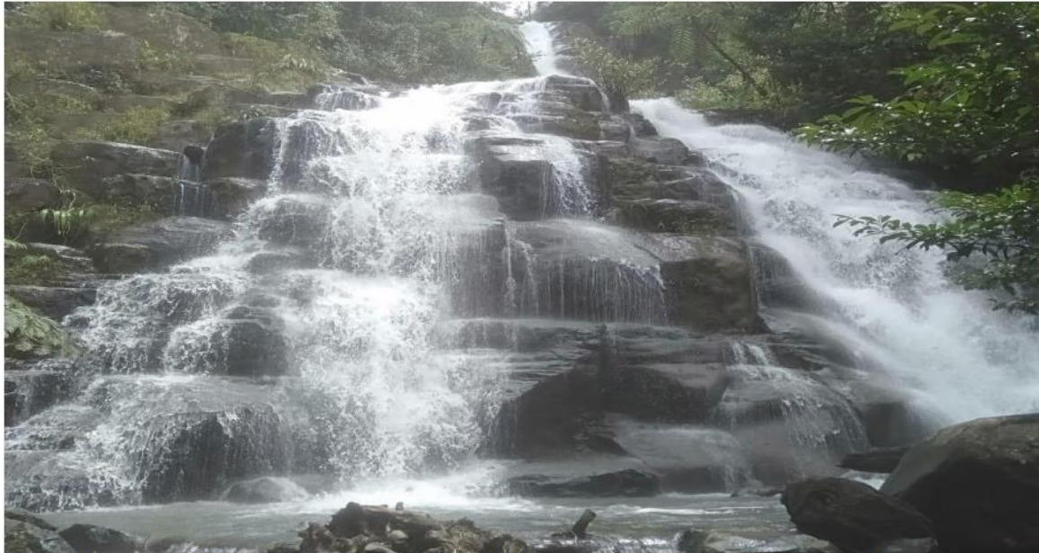
Gambar 1 Air terjun lima tingkat Sikayan Balumuik

Lokasi wisata ini tidak hanya menyuguhkan air terjun tetapi juga keindahan alam yang dapat dinikmati sepanjang perjalanan menuju ke lokasi air terjun tersebut. Keelokan alam dengan paparan perbukitan, hamparan sawah, dan sungai merupakan satu kesatuan yang merupakan penyempurna keindahan dilokasi wisata. Keelokan alam dilokasi tidak hanya memanjakan mata tapi juga ditambah dengan udara yang sejuk.