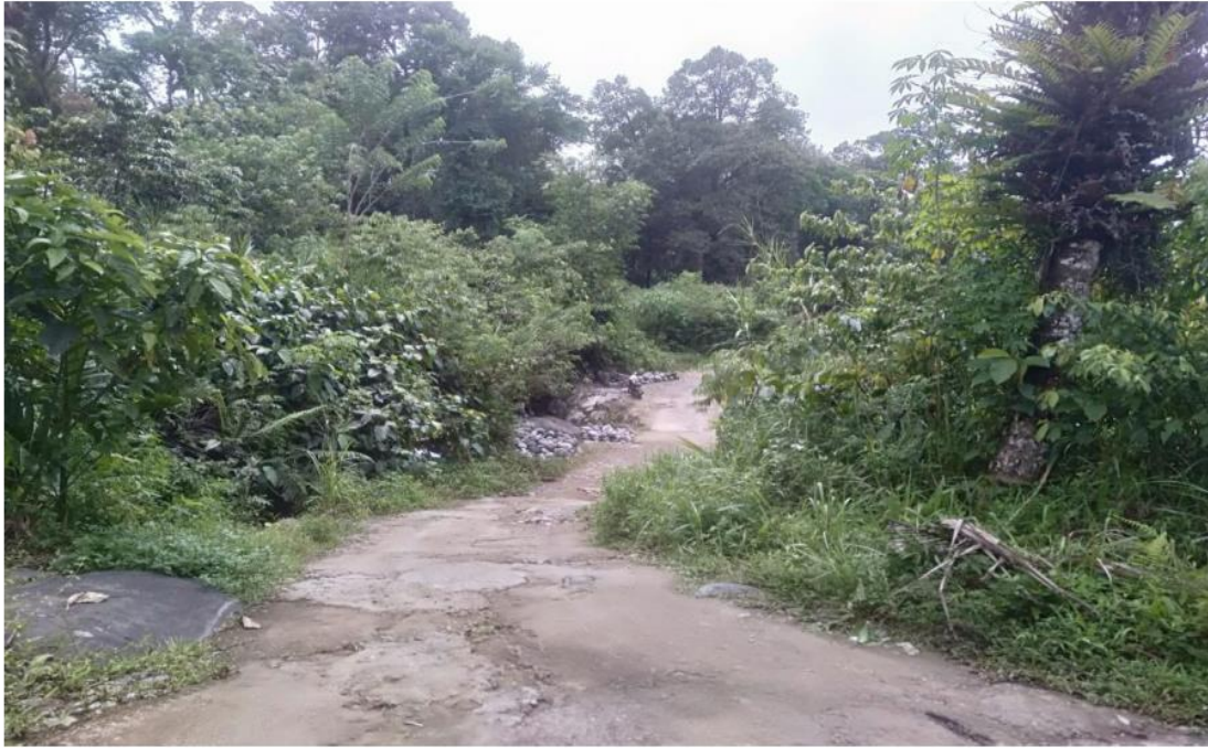
Gambar 4 Akses jalan menuju lokasi

Akses yang ditempuh di lokasi air terjun dapat mempergunakan kendaraan pribadi dan kendaran umum. Kendaran umum yaitu berupa angkot jurusan Ulu Gaduik - Pasar Raya Padang dengan no trayek 307, kemudian dilanjutkan dengan angkutan jurusan Koto Baru yang berhenti pada pemberhentian akhir. Perjalanan dilanjutkan dengan jalan kaki sejauh 6 km karena medanya yang masih alami, berupa jalan setapak dan tidak bisa mempergunakan kendaraan. Perjalanan yang dilalui cukup jauh dengan estimasi waktu kurang lebih 1 1/5 jam lamanya ke lokasi tujuan.