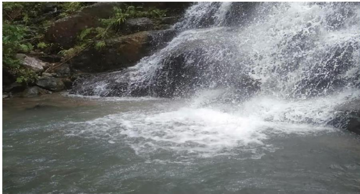
Gambar 2 Kolam pemandian dan berendam di bawah air terjun

Lokasi wisata ini tidak hanya menyuguhkan air terjun tetapi juga keindahan alam yang dapat dinikmati sepanjang perjalanan menuju ke lokasi air terjun tersebut. Keelokan alam dengan paparan perbukitan, hamparan sawah, dan sungai merupakan satu kesatuan yang merupakan penyempurna keindahan dilokasi wisata. Keelokan alam dilokasi tidak hanya memanjakan mata tapi juga ditambah dengan udara yang sejuk.