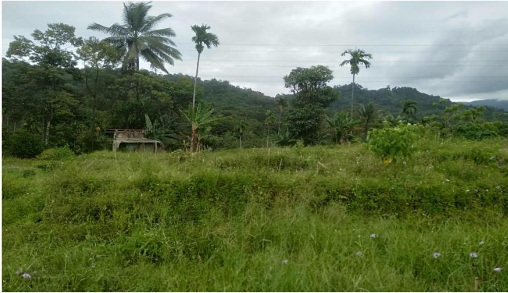
Gambar 5 Keadaan alam di lokasi (Dokumen pribadi)