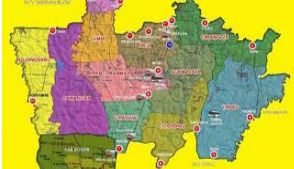
Gambar 1 Peta Kelurahan Cinangka