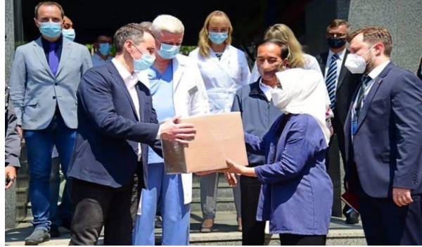
Gambar 6 Ibu Negara secara simbolis menyerahkan bantuan kemanusiaan. Pemerintah Indonesia pula membagikan bantuan lewat Palang Merah Ukraina.

Sumber: Official Instagram Presiden Joko Widodo 73