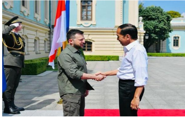
Gambar 2 Jokowi tiba disambut langsung oleh Zelensky di pintu masuk istana. Sumber: Official Website Sekretariat Presiden 66

bahwa dirinya sangat menghargai bantuan dari Indonesia dalam mengupayakan kebebasan serta kemerdekaan Ukraina.