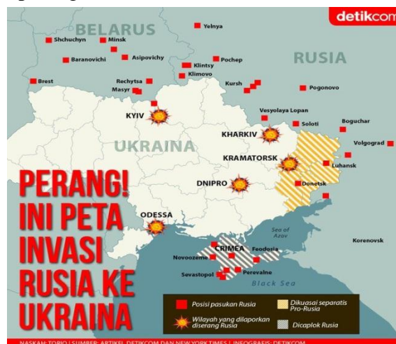
Gambar 1 Lokasi Perang Rusia ke Ukraina

Sumber: Official Website News.Detik.com 60