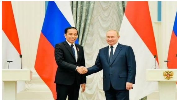
Gambar 10 Jokowi dengan Putin setelah melaksanakan konferensi pers bersama di Istana Kremlin, Moskow, Rusia.

cukup lama menghasilkan di Indonesia sampai sekarang. Dengan kerja sama para ahli, spesialis, dan pengembang Rusia, penunjang kendaraan dan prasarana modern yang sangat besar, arena, klinik darurat, dan organisasi penting lainnya banyak di antaranya berfungsi hingga saat ini. Presiden Vladimir Putin mengungkapkan bahwa perbincangan bersama Jokowi diterapkan oleh metode bisnis yang sangat besar.