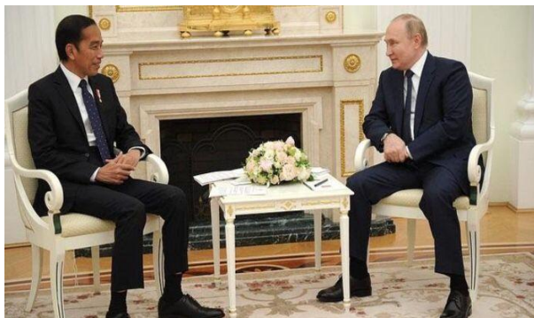
Gambar 8 Jokowi dan Putin berbincang di Istana Kremlin, Moskow.

Pada 30 Juni 2022, Jokowi menemui Putin di Istana Kremlin dalam rangka membicarakan mengenai isu kemanusiaan dan upaya menghentikan permusuhan kedua negara tersebut, sembari memberikan dua tujuan penting yang dibawa oleh Indonesia yaitu 1) Mengaplikasikan persuasi ke Putin untuk membuka rute suplai ekspor gandum Ukraina, 2) Mengundang Putin dalam menghadiri KTT G20 di Bali pada 15-16 November 2022. 84