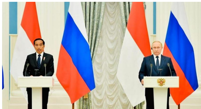
Gambar 9 Kunjungan Jokowi terhadap Putin.

Hasil dari agenda itu, Putin bersetuju membuka jalur ekspor gandum Ukraina serta membagikan jaminan suplai terhadap komoditas pupuk Rusia dalam usaha guna pengukuhan kedua komoditi itu ke dalam rantai pasok dunia. 87