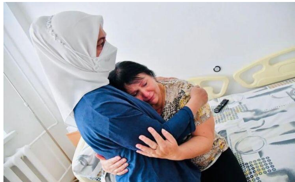
Gambar 5 Mendatangi sebuah rumah sakit di pusat kota Kyiv yang merawat para korban perang.

Sumber: Official Instagram Presiden Joko Widodo 71