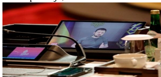
Gambar 12 Zelensky berbicara melalui konferensi video dalam acara KTT G20 di Indonesia, 16 November 2022.

Presiden Volodymyr Zelensky mengingatkan kembali bahwa Kyiv bersikeras untuk memberikan jaminan keamanan internasional dan telah mengembangkan draf dokumen terkait. Presiden Ukraina itu mengatakan, Kita harus mengadakan konferensi keamanan internasional Kyiv untuk mengkonsolidasikan elemen kunci dari arsitektur keamanan di ruang Euro-Atlantik, termasuk jaminan untuk Ukraina, katanya, seraya menambahkan bahwa hasil utama dari konferensi ini. Menurut rencana Kyiv, harus penandatanganan "Perjanjian Keamanan Kyiv ". Menurut pemimpin Ukraina, Kyiv siap mengadakan acara ini kapan saja, bahkan tahun 2022.