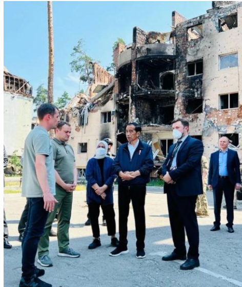
Gambar 4 Presiden Joko Widodo mengunjungi satu lokasi puing-puing kompleks apartemen di Kota Irpin.

Rusia serta Ukraina, yang bertujuan menghentikan permusuhan antar kedua negara. Jokowi menyebutkan meskipun sulit dicapai, akan tetapi semangat perdamaian harus senantiasa dilontarkan dan diupayakan.