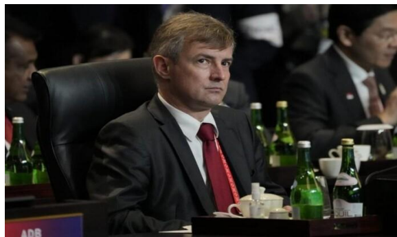
Gambar 13 Kepala Kementerian Luar Negeri Rusia, Sergey Lavrov, menyampaikan pendapatnya saat di agenda KTT G20 di Indonesia, 16 November 2022.

Sedangkan dari Pihak Rusia yaitu Kepala Kementerian Luar Negeri Rusia, Sergey Lavrov hadir secara langsung sedangkan Presiden Vladimir Putin tidak hadir maupun daring dan tatap muka. Lalu dalam forum G20 itu Kepala Kementerian Luar Negeri Rusia mengemukakan, Rusia mencatat bahwa baik Amerika Serikat dan semua sekutunya cukup agresif selama diskusi, menuduh Rusia melakukan agresi tanpa alasan terhadap Ukraina. Kepala Kementerian Luar Negeri Rusia Sergey Lavrov sekali lagi menyatakan bahwa menurut Federasi Rusia, ini bukanlah agresi oleh Rusia, tetapi operasi untuk melindungi kepentingan keamanan Rusia yang sah yang di perbatasannya terdapat ancaman militer dan operasi untuk melindungi penduduk Rusia di Donbas.