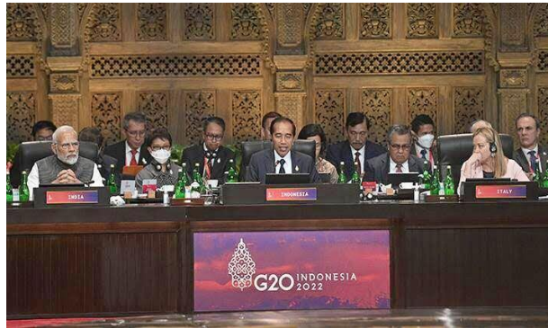
Gambar 11 Indonesia dalam Pelaksanaan KTT G20 di Bali.

keterlibatan perdagangan antar anggota terutama di era pemulihan pasca-Covid19 dan energi terbarukan, semuanya ada di meja diskusi. 98