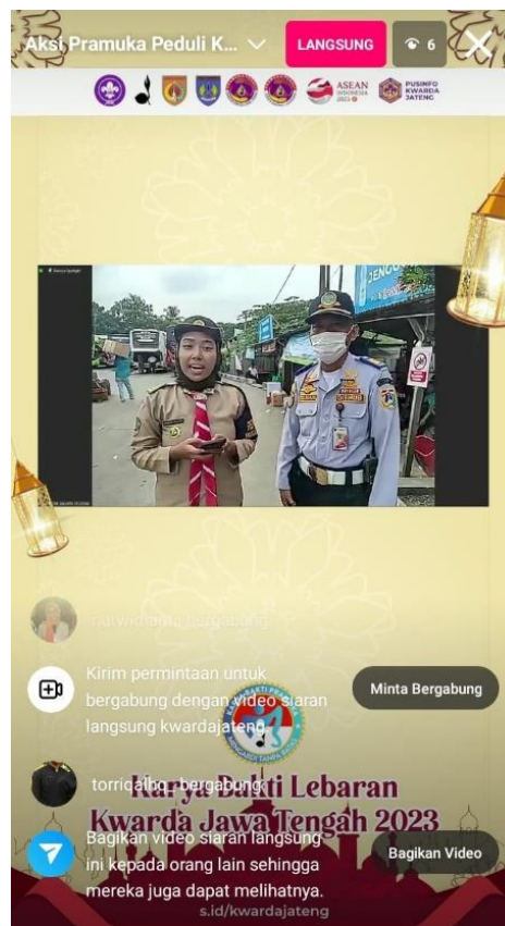
Gambar 7. Live Report Karya Bakti Lebaran bersama Dishub

Dapat disimpulkan bahwa Humas Kwartir Cabang Jakarta Selatan dalam menjalankan perannya sebagai Back Up Management berupa :