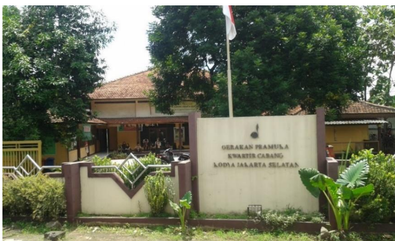
Gambar 3. Gedung Kwartir Cabang Jakarta Selatan