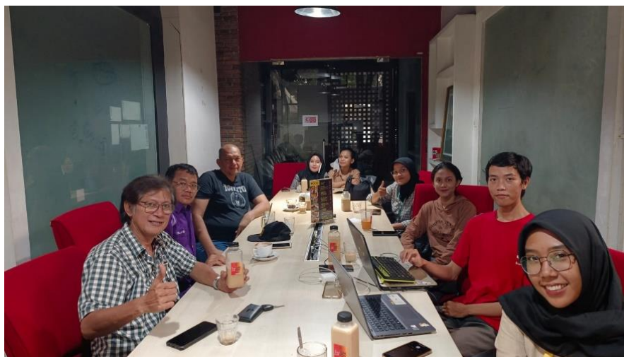
Gambar 5. Rapat Kerja Humas Kwartir Cabang Jakarta Selatan

Dari pernyataan diatas dapat diketahui bahwa pelaksanaan peran Humas sebagai communicator dilakukan secara komunikasi langsung dalam rapat kerja. Proses penyampaian informasi kepada publik internal Kwartir Cabang Jakarta Selatan bertujuan untuk meningkatkan kekompakkan antar anggota dan mengingatkan anggota humas untuk selalu memahami tujuan pembinaan di organisasi Gerakan Pramuka.