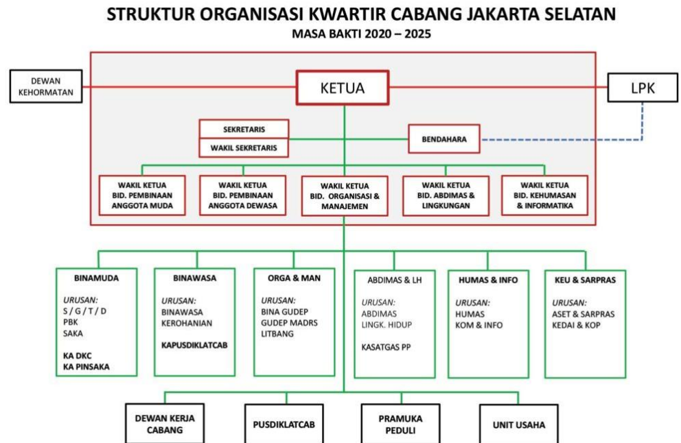
Gambar 4. Struktur Organisasi Kwartir Cabang Jakarta Selatan