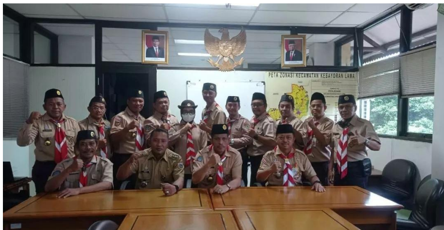
Gambar 8. Kunjungan Ketua Kwartir Cabang Jakarta Selatan ke Kwartir Ranting Kebayoran Lama