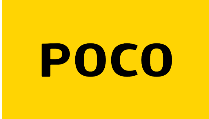
Gambar 4. 2 Logo Poco