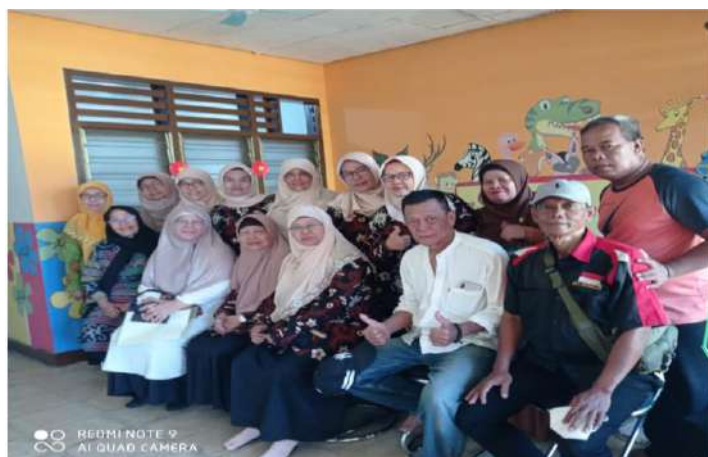
Gb 2. Kunjungan Awal ke TK Aisyiyah Busthanul Athfal PCA Senen

TK Aisyiyah Busthanul Athfal PCA senen ini terletak di wilayah padat penduduk dengan kondisi perekonomian masyarakat yang terbatas. TK ini baru berdiri 3 (tiga) bulan yang lalu, tepatnya tanggal 6 Juni 2023. Berdasarkan hasil kunjungan awal dan wawancara dengan beberapa guru serta Kepala Sekolah TK tersebut yaitu Ibu Cicoh, didapat informasi bahwa masih banyak yang perlu dibenahi dan ditingkatkan kembali.