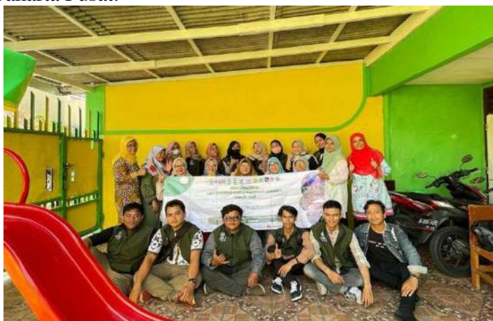
Gb 1. TK Aisyiyah Busthanul Athfal, PCA Senen

Kegiatan Kuliah Kerja Nyata (KKN) adalah salah satu bentuk pengabdian kepada masyarakat yang dilakukan oleh Dosen dan mahasiswa di seluruh Universitas di Indonesia termasuk Universitas Muhammadiyah Jakarta. Kegiatan KKN ini dilakukan oleh mahasiswa dari berbagai Prodi dengan dibimbing oleh seorang Dosen Pembimbing Lapangan (DPL) untuk tiap-tiap PCA di wilayah Jakarta dan sekitarnya, serta di beberapa daerah dan luar negeri. KKN yang dilaksanakan di UMJ ini umumnya adalah dengan terjun langsung ke amal usaha Muhammadiyah, seperti halnya TK. Aisyiyah Busthanul Athfal PCA Senen, Jakarta Pusat.