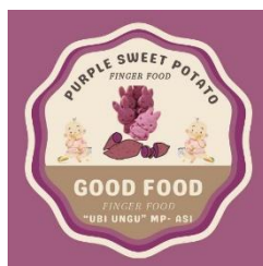
Gambar 3.3 Desain Logo “finger food ubi ungu” ukuran 8 cm