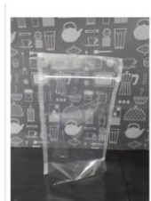
Gambar 3.1 contoh kemasan plastik standing pouch