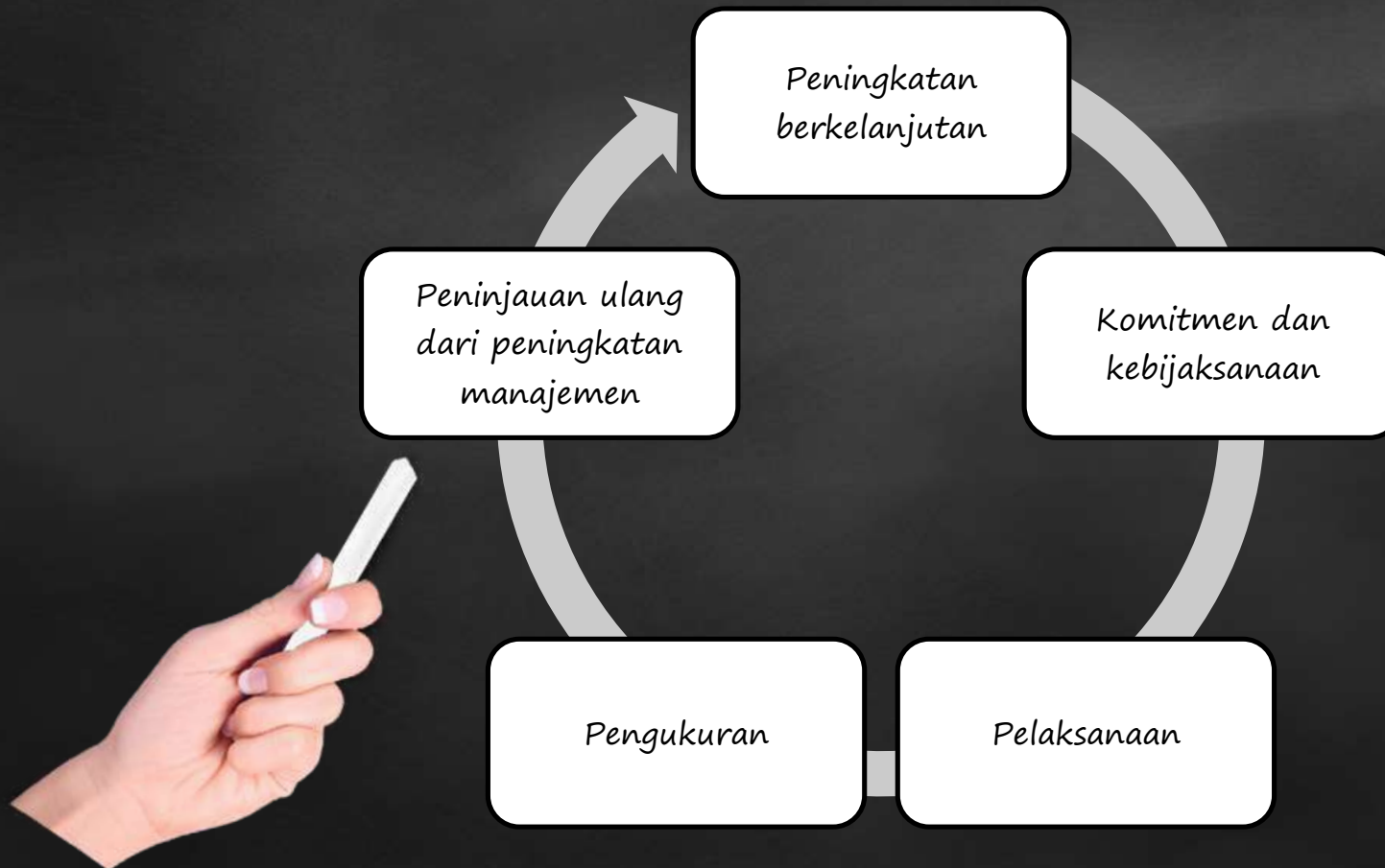
Gambar: Peningkatan kinerja bidan (dr. Gempur, 2004:15)