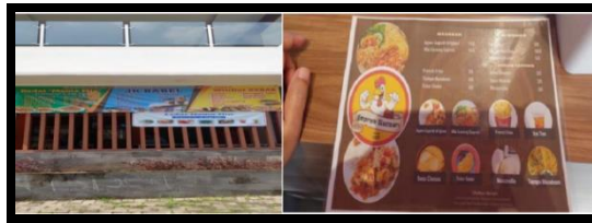
Gambar 2. Cafe Pancasila