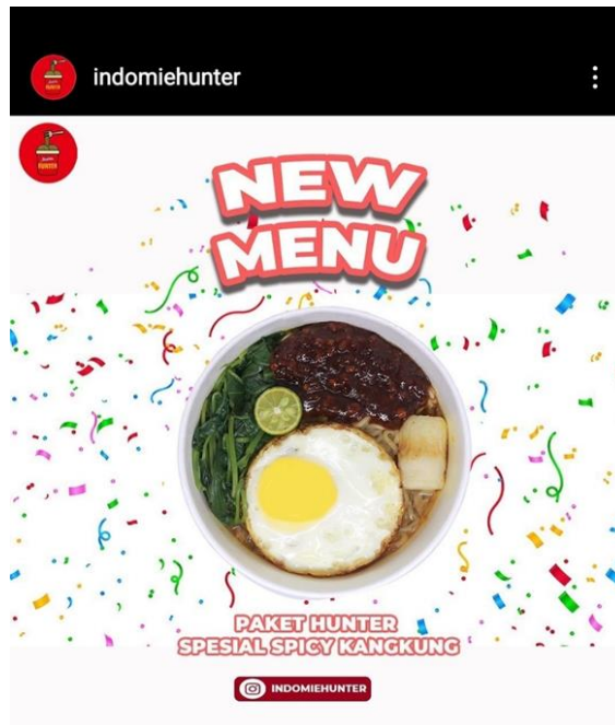
Gambar 4.9 Informasi yang tersedia di media sosial instagram Kedai Indomie Hunter

“untuk informasi tentang produk yang kita jual di media sosial yang kita punya itu sangat penting, karena memudahkan para calon konsumen maupun konsumen dalam mencari informasi mengenai produk yang kita jual tersebut, dalam media sosial tersebut kita harus benar-benar memberikan informasi yang lengkap tentang apapun mengenai produk kita tersebut.” (13 Juli 2022)