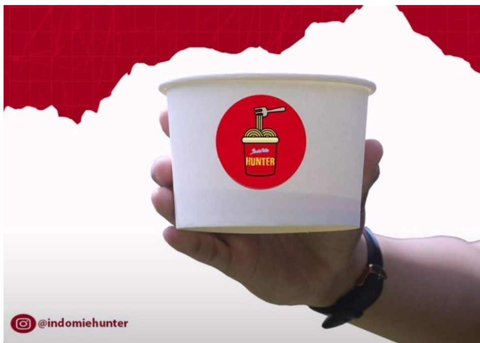
Gambar 4.5 Packaging Kedai Indomie Hunter

“tentu punya, yaitu packaging indomie hunter menggunakan cup yang terdapat logo indomie hunter tersebut, jadi selain packaging yang unik, indomie hunter juga bisa dikenal dari satu orang ke orang yang lain dengan packagingnya tersebut, karena kita kan memang konsepnya itu tidak menyediakan dine in kan hanya takeaway karena akibat covid-19 ini, jadi packaging kita juga harus memuat segala unsur kedai indomie hunter itu untuk memudahkan strategi branding kita dengan packaging yang kita punya.” (8 Juni 2022)