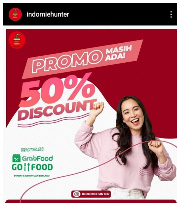
Gambar 4.7 Kegiatan Promosi Kedai Indomie Hunter Melalui Media Sosial Instagram

“untuk kegiatan promosi melalui media sosial biasanya ada potongan setengah harga di waktu-waktu tertentu, karena kegiatan promosi ini sangat digemari oleh para konsumen dan hal seperti ini memudahkan kita dalam melakukan branding untuk produk kita tersebut, terlebih lagi ketika pandemi covid-19 berlangsung, diskon seperti potongan harga ataupun beli satu gratis satu tentu sangat digemari oleh para masyarakat.” (13 Juli 2022)