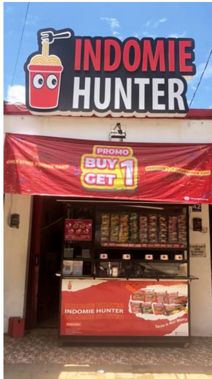
Gambar 4.1 Kedai Indomie Hunter