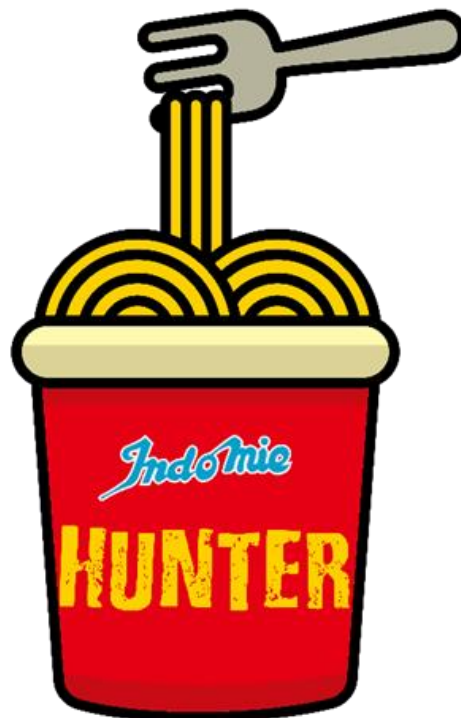
Gambar 4.3 Logo Kedai Indomie Hunter

“ada sebenarnya, maksud dari logo indomie hunter itu terdiri dari cup, dan garpu agar masyarakat berfikir kalau indomie hunter itu tidak menyediakan dine in, indomie hunter itu hanya menyediakan take away, maka dari itu agar masyarakat itu awaree kalau indomie hunter itu hanya menyediakan take away, maka dari itu maksud dari logo indomie hunter terdiri dari cup dan garpu adalah sekaligus memberikan informasi bahwa indomie hunter itu hanya melayani take away dan tidak menyediakan dine in karena masa pandemi covid-19 yang dimana pemerintah membatasi kegiatan diluar ruangan, lalu juga logo indomie hunter itu identik dengan warna merah karena menurut saya warna merah itu memang sudah menjadi ciri khas bagi produk-produk makanan, karena warna merah itu memicu nafsu makan ” (8 Juni 2022)