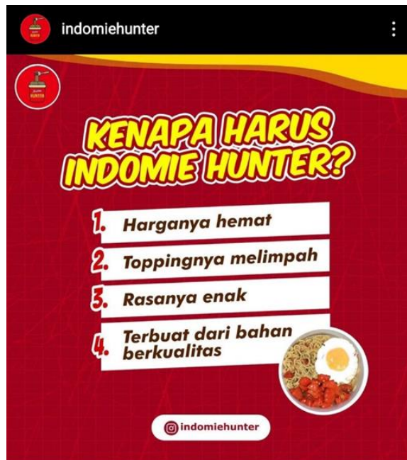
Gambar 4.8 Kegiatan branding Kedai Indomie Hunter melalui media sosial instagram