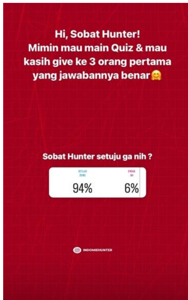
Gambar 4.10 Kegiatan tanya jawab dengan para konsumen Kedai Indomie Hunter

“kalo untuk menjalin hubungan dengan para konsumennya kita mengajak para konsumen untuk bermain games atau kuis di instagram indomie hunter, dengan hubungan yang terjalin tersebut tentu akan medapat kepercayaan yang lebih dari para konsumen, dan juga bisa terjalin hubungan jangka panjang dengan para konsumen, akibat covid-19 mau tidak mau kita harus melakukan interaksi melalui media sosial yang kita punya ya.” (13 Juli 2022)