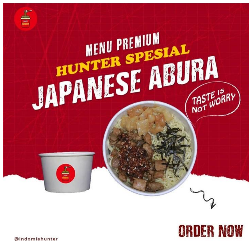
Gambar 4.4 Tagline Kedai Indomie Hunter

“untuk slogannya itu taste is not worry, atau bahasa indonesianya itu jangan khawatir soal rasa, karena slogan tersebut mengingatkan para konsumen untuk tidak perlu khawatir tentang rasa makanan yang indomie hunter berikan, dan slogan tersebut menurut saya lebih mudah diingat dengan para konsumen karena slogan tersebut terkesan simple.” (8 Juni 2022)