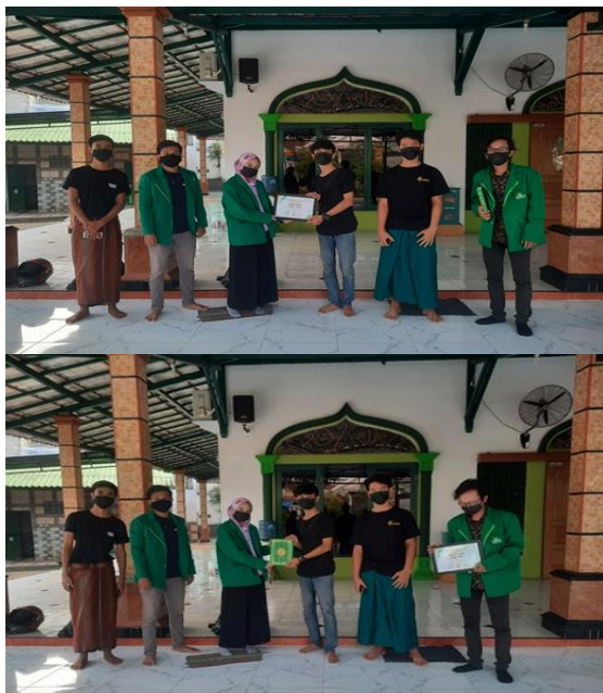
Gambar 3. Kegiatan Penyerahan Piagam Penghargaan dan Pemberian Al-Qur'an