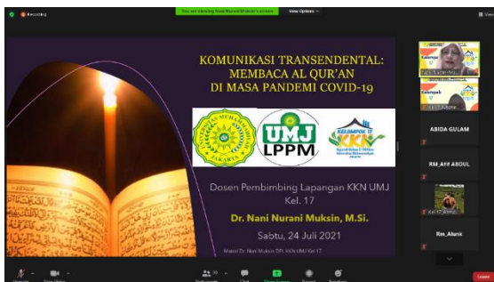
Gambar 2. Materi Narasumber Dr. Nani Nurani, S.Sos, M.Si

Kemudian, kita dituntut untuk menguatkan imun tubuh agar bisa terhindar dari paparan virus Covid-19, seperti menaati protokol kesehatan, mengatur pola makan, dan istirahat dengan cukup. Namun, selain imun tetap terjaga, iman pun menjadi landasan utama untuk kita bisa menjaga keadaan hati, jiwa, dan tubuh di dalam situasi pandemi. Salah satunya dengan memperbanyak dan sering membaca Al-Qur'an. Dengan melakukannya kita dapat meningkatkan kemampuan dan kelancaran dalam membaca Al-Qur'an.