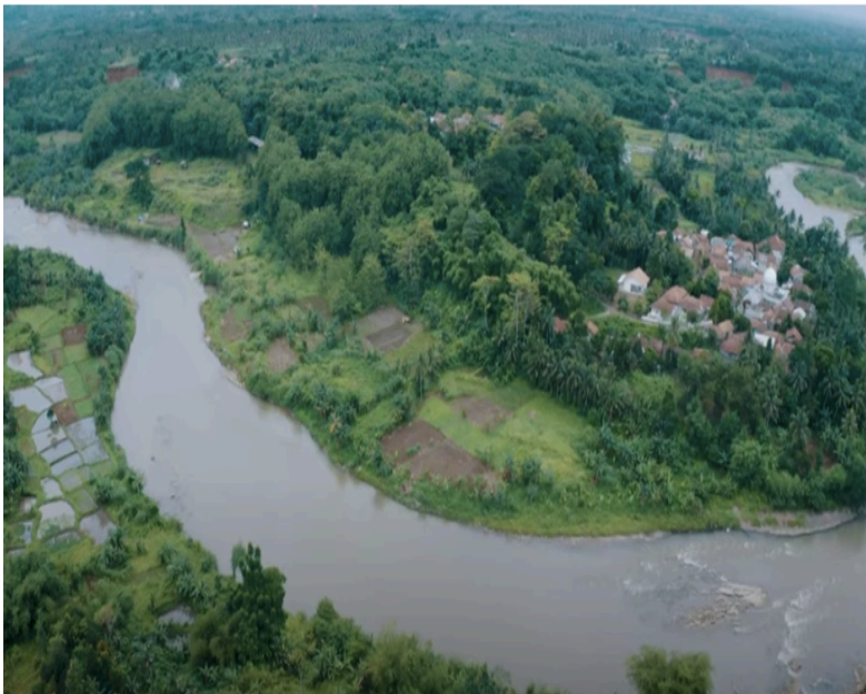
Gambar 1. Gambar Letak Desa Kuripan.

cepat. Dibukanya pabrik-pabrik di sekitar BSD Tangerang Selatan dan di Bogor (Parung dan Gunung Sindur) serta perkembangan toko-toko di pasar Parung menyerap tenaga kerja dari daerah sekitarnya termasuk desa Kuripan.