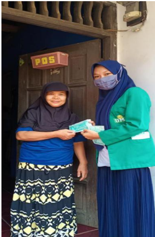
Gambar 4. Pembagian Masker kepada Warga