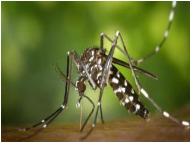
Nyamuk Aedes aegypti

Penyebaran virus dengue melalui gigitan nyamuk Aedes aegypti dan nyamuk Aedes albopictus