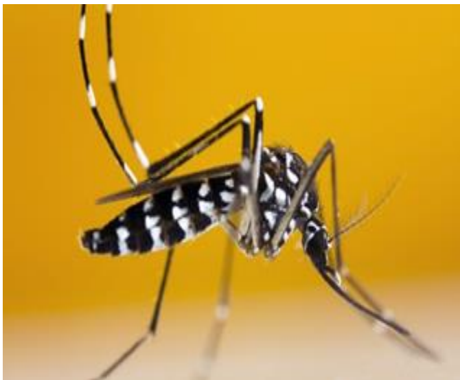
Nyamuk Aedes albopictus